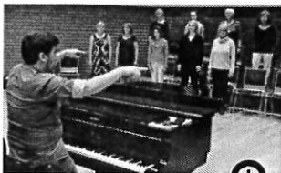
Öffentliche Probe der Chor-Akademie im Bürgerhaus Vegesack. (Kalka)

Die „Europa-Chor-Akademie Projekt gGmbH“ mit Sitz in der Bürgermeister-Wittgenstein-Straße ist insolvent. Das wurde am am Mittwoch bekannt. Zwei geplante Konzerte im Oktober, einmal „Paulus“ in der